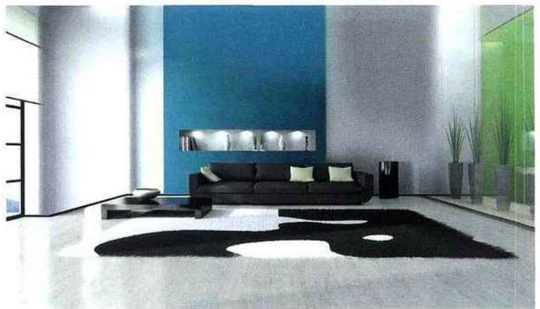
▲ 2 PANS DE MURS, en touches colorées réveillent l'ambiance et donnent de la perspective. Théodore décoration.

Créer le style. Pas de doute, question mobilier et déco, le noir et le blanc s'imposent comme l'incarnation du style et du design. Ils constituent souvent une toile de fond sur laquelle les meubles viennent se fondre, pour créer l'ambiance d'une distinction froide, mais aussi moderne et élégante. Pour réveiller et réchauffer la pièce, les teintes vives s'invitent en petites touches: tableaux, meubles ou un simple pan de mur. L'essentiel, pour rester dans un style contemporain, >>>