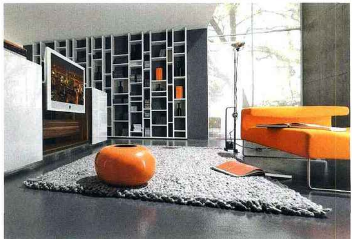
▲ DE L'ORANGE POP, en touches précises donne toute sa personnalité au salon. Hulsta.

P our accéder à un repos bien mérité, la déco se fait minimaliste et très chic. Lignes pures, écrans plats, meubles design, éclairage tamisé issu de différentes sources lumineuses et associations de couleurs savamment étudiées. C'est forcément ici que doivent s'exprimer le goût et la sensibilité des habitants, c'est là que le logement prend toute sa personnalité. À la fois intimiste et ouvert sur l'extérieur, puisqu'on y reçoit, le salon se doit d'avoir une déco bien pensée, pour que chacun s'y sente bien. Les canapés seront les éléments centraux du décor. Plus ils sont grands, plus ils sont accueillants, laissant place à la fois aux invités et aux moments de repos, permettant de s'y prélasser en toute quiétude. Côté matières, cuir et tissu se partagent la vedette. Côté couleurs, elle doit avant tout s'adapter au reste. Un canapé coloré ou imprimé attirera toute l'attention, pour une invitation à s'y lover, les murs devront alors se faire plus discrets, pour lui laisser la vedette. >>>