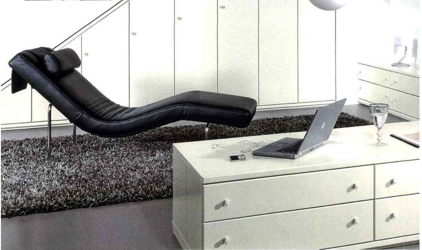
LE CHIC intemporel du noir et blanc. Hulsta.

POUR LES PURISTES, le béton ciré est aujourd'hui pratiquement incontournable pour mettre son salon au top de la tendance. Et pour les bricoleurs, la société Béton ciré on line propose toute une gamme de produits, de qualité professionnelle, adaptée aux particuliers. La boutique comprend des kits entiers ou des éléments séparés et le site permet de visualiser les étapes pas à pas de la mise en œuvre. www.betoncire-online.com