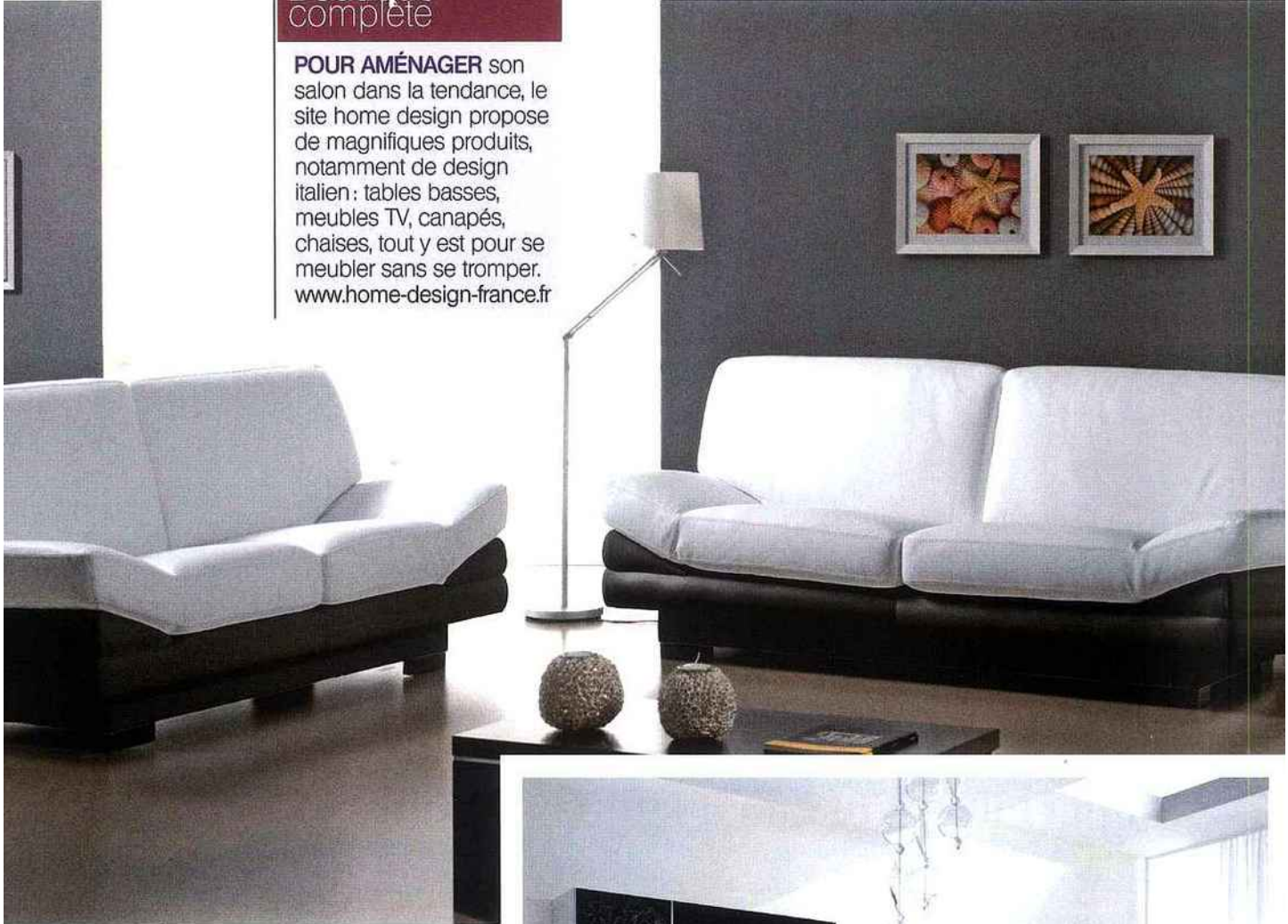
▲ CANAPÉS ZANISOFA, 2 et 3 places en cuir, sur Home design.

POUR AMÉNAGER son salon dans la tendance, le site home design propose de magnifiques produits, notamment de design italien : tables basses, meubles TV, canapés, chaises, tout y est pour se meubler sans se tromper. www.home-design-france.fr